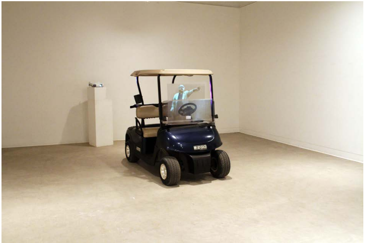
Trou de panique Sculpture : voiturette de golf, plexiglas, vidéoprojection, enceinte, café. 2019