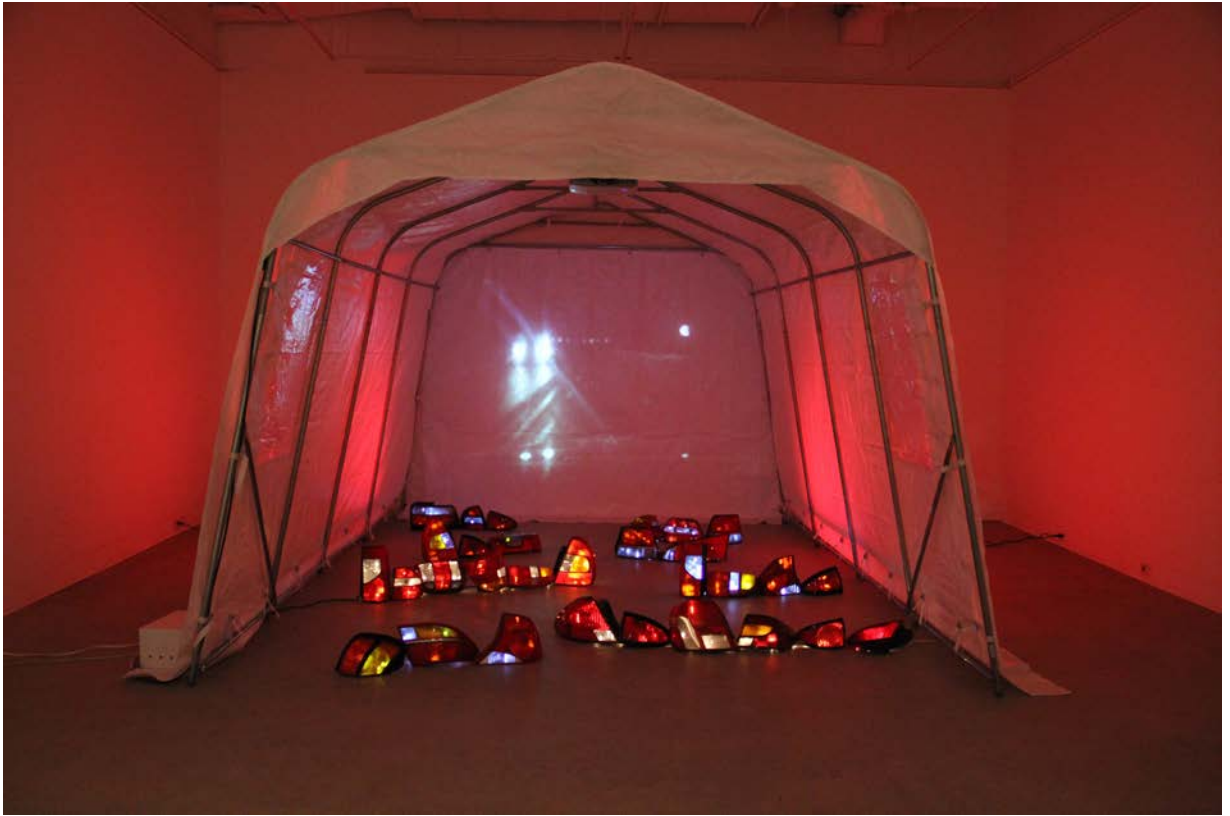
Fahrenheit Installation : abri tempo, phares arrière d'automobiles, vidéo-projection, spots, guirlandes lumineuses. 2017