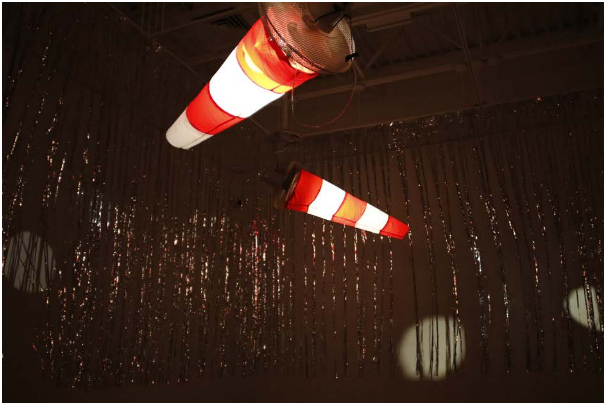
Nyx, don't be afraid (1) Installation : manches à vent, ventilateurs, rideaux, ampoules. 2019